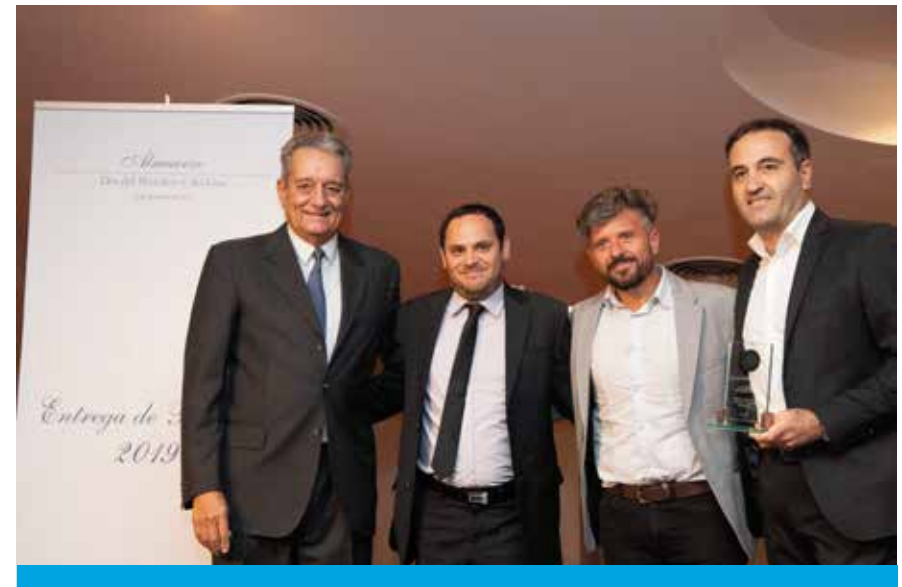
Premio Nacional a la Seguridad 2019