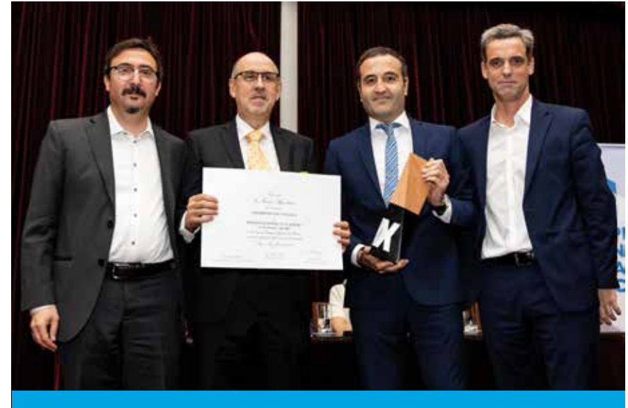
Premio Nacional a la Calidad 2019

En 2019 fuimos reconocidos con el Premio Nacional a la Calidad 2019 y el Premio de la Seguridad del IAPG.